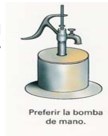
Preferir la bomba de mano.

Desinfección del agua y almacenamiento seguro: